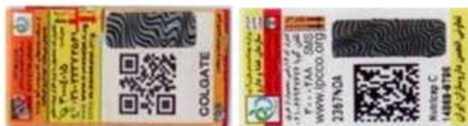
برجسب تقلبی و نا معتبر